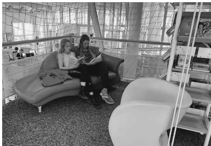
Schmökern in der gemütlichen Jugendecke

- bei Fragen zum Gebührenbescheid - 2360