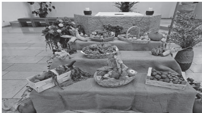
Kirche in Unterankenreute, Quelle: Eugen Nunnemacher