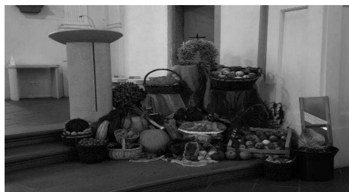
Kirche in Bodnegg