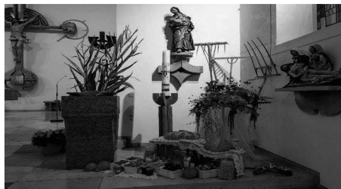
Kirche in Schlier, Quelle: Michaela Jäger