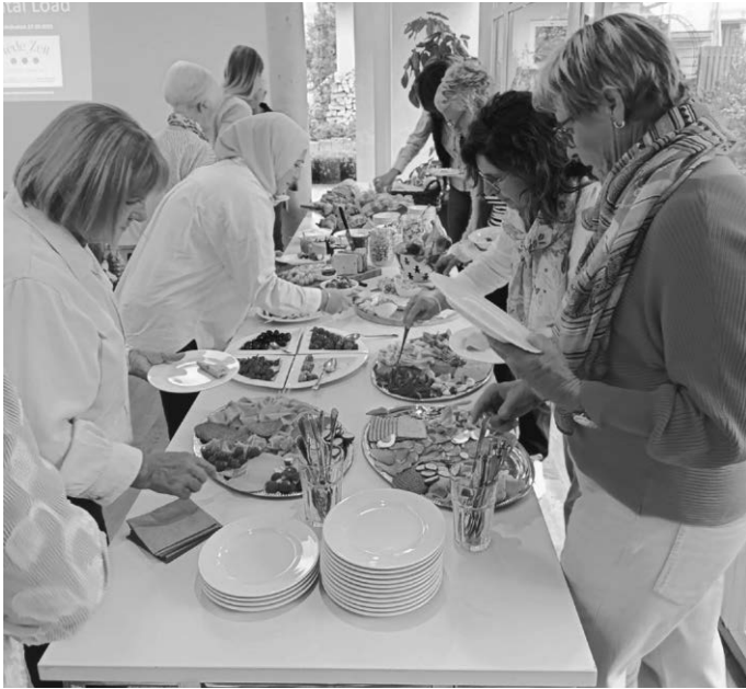
Von Frauen für Frauen, das Frühstücksbuffet lässt keine Wünsche offen.

Wie also können die Alltagsaufgaben, die normalerweise als nicht der Rede wert erachtet werden in Beziehungen besser verteilt werden, wie kann man die Verantwortung für den Tagesablauf abgeben? Im Dialog entstehen Anregungen und Empfehlungen, der Austausch tut gut und die Referentin unterstützt das Erkennen auch der eigenen Unzulänglichkeiten. Ein spannender Vormittag für alle Sinne war dieses Frauenfrühstück dank des engagierten Vorbereitungsteams einerseits und einer ambitionierten und imponierenden Rednerin andererseits.