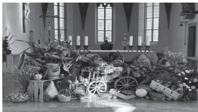
Kirche in Grünkraut

Am ersten Sonntag im Oktober durften wir in unserer Seelsorgeeinheit Erntedank feiern und die Freude und Schönheit der ganzen Schöpfung feiern. Danke allen guten Händen , die die wunderschönen Erntedankaltäre geschmückt und bereitet haben, die Obst, Gemüse und Blumen gespendet haben und Groß und Klein vor Augen gestellt haben, wie großartig unser Schöpfer-Gott ist!